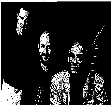
John Scofield Trio

Fredag den 5. oktober kl. 21.00 på Tobakken